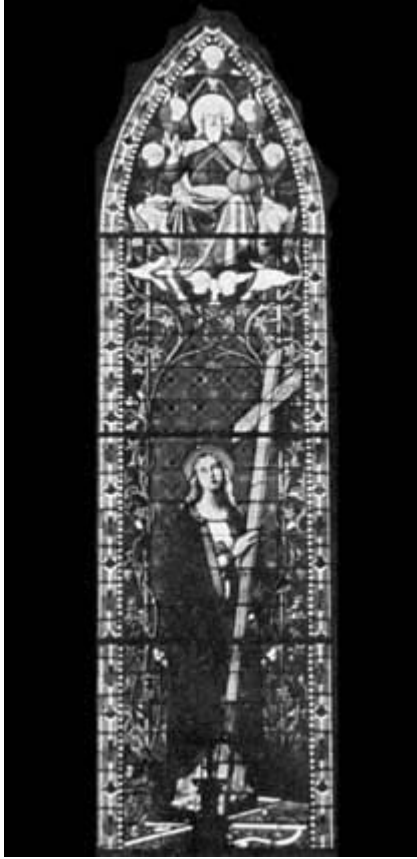
VETRATA DELLA CHIESA DI SANTA GIULIA IN TORINO