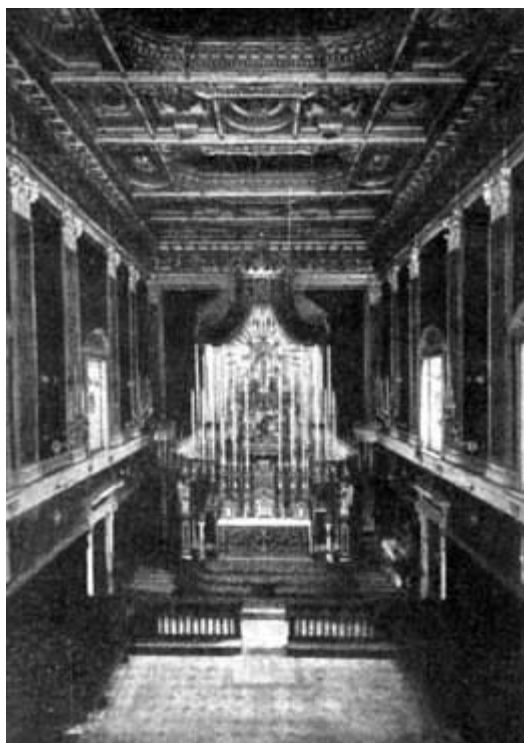
INTERNO DELLA CHIESA DI S. GIULIA