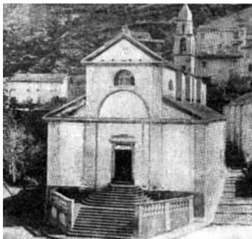
NONZA - SANTA GIULIA

Il Gianola annota che nel coro esiste un grande quadro che la rappresenta crocifissa. Lo stesso soggetto viene ripetuto in un damasco rosso molto antico che viene portato in processione il 22 maggio. La processione istituita nel 1927 dallo zelante e attivo don Morazzini-Pietri con scadenza triennale richiama grandissima folla da tutto Capo Corso, da Bastia e da tutta l'isola, mentre il paese innalza un magnifico arco di trionfo. Ogni famiglia accende ceri dinnanzi alla statua della santa o al reliquiario in bronzo dorato contenente un pezzo del cranio e due vertebre 9 .