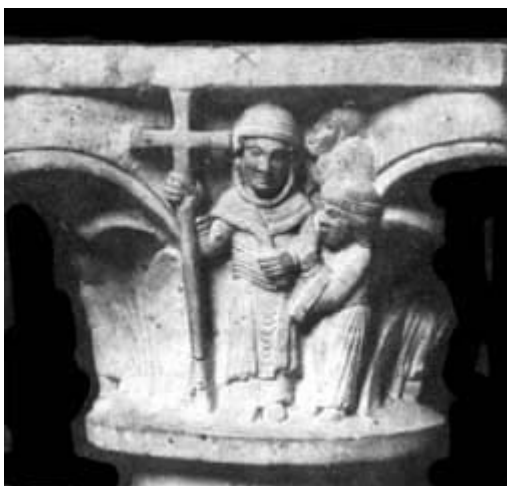
SANTA GIULIA TRA LE BADESSE E LE MONACHE (Capitello della cripta di S. Salvatore, Brescia)

Le più antiche raffigurazioni artistiche sono offerte in un capitello di scuola antelamica del sec. XII in cui la santa è raffigurata su due lati nel martirio e assieme alla Badessa e alle suore del monastero bresciano. I capitelli che adornano la cripta del monastero sono oggi nel Museo Cristiano. Allo stesso periodo (sec. XII-XIII) viene fatto risalire un affresco ritrovato nel 1958 sull'esterno della vicina chiesa di S. Salvatore.