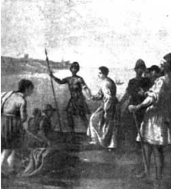
ARRESTO DELLA SANTA Quadro di G. B. Marcati - sec. XVI