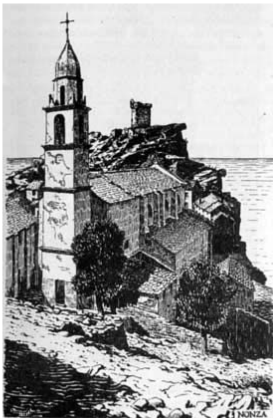
NONZA - SANTA GIULIA