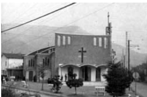
CHIESA DI S. GIULIA VILLAGGIO PREALPINO - BRESCIA

Infatti erano appena entrate le prime famiglie che c'erano già il prete e la chiesa, sia pure provvisoria.