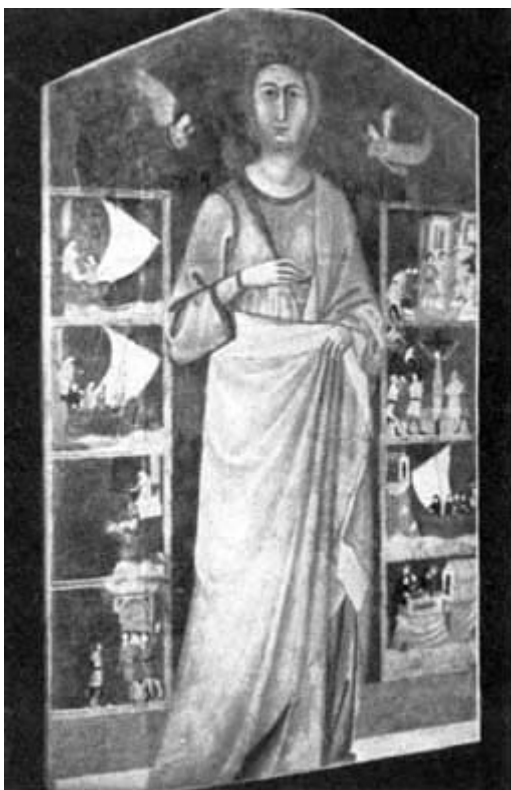
PREGEVOLE QUADRO DI SANTA GIULIA (Scuola giottesca)