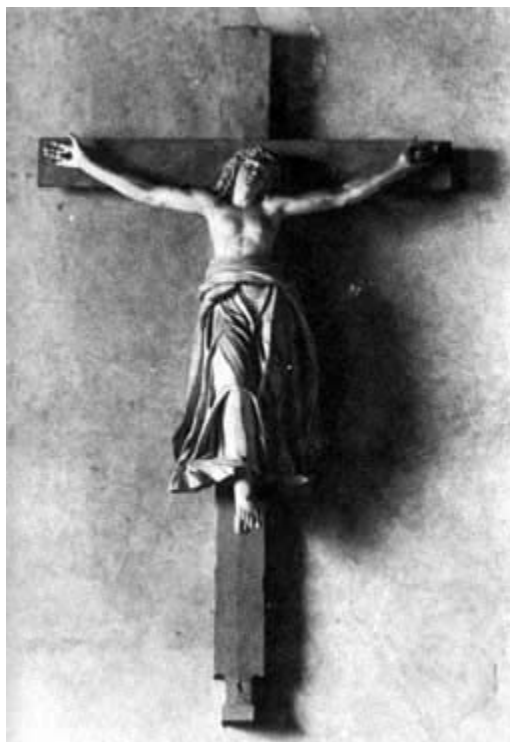
SANTA GIULIA CROCEFISSA Scuola dei Carra