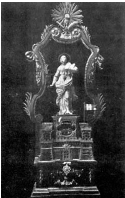
RELIQUIARIO IN ARGENTO CONTENENTE RELIQUIE DELLA PATRONA S. GIULIA