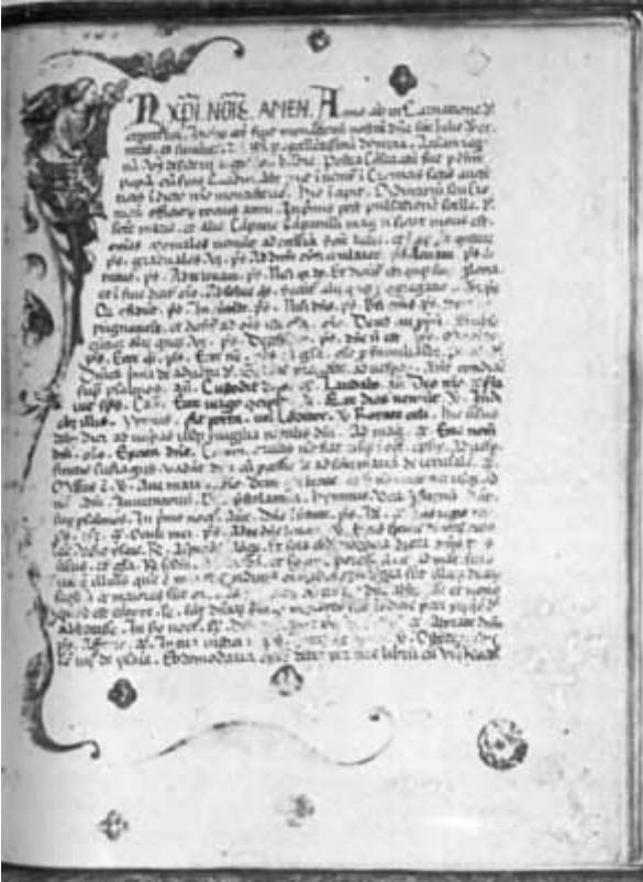
RITUALE DI SANTA GIULIA (ORDINARIUM SEU CHRONICA OFFICIORUM TOTIUS ANNI)