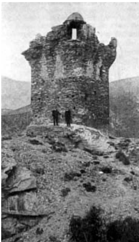
NONZA. LA STORICA TORRE