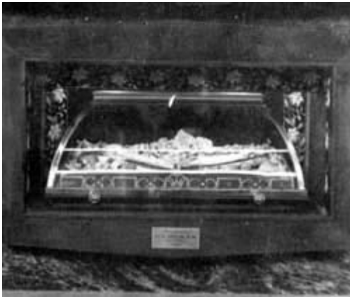
L'URNA DI SANTA GIULIA (Nel sarcofago dell'altare maggiore della chiesa del Villaggio Prealpino - Brescia)