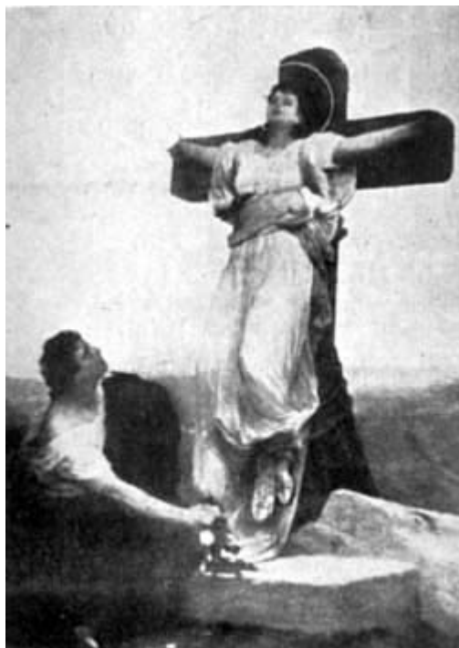
DOPO LA CROCISSIONE, EUSEBIO DESTATOSI DAL LETARGO DEPONE FIORI AI PIEDI DELLA CROCE DELLA SUA DILETTA E SANTA SCHIAVA