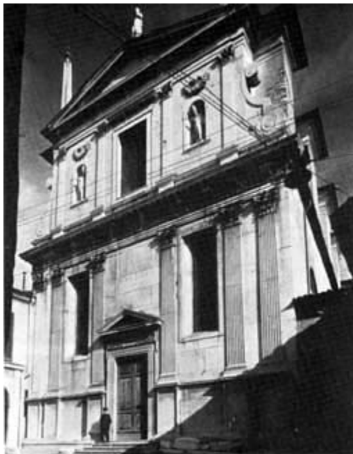
CHIESA DI S. GIULIA: FACCIATA