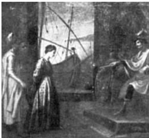
LA SANTA DAVANTI AL GIUDICE Quadro di G. B. Marcati - sec. XVI.