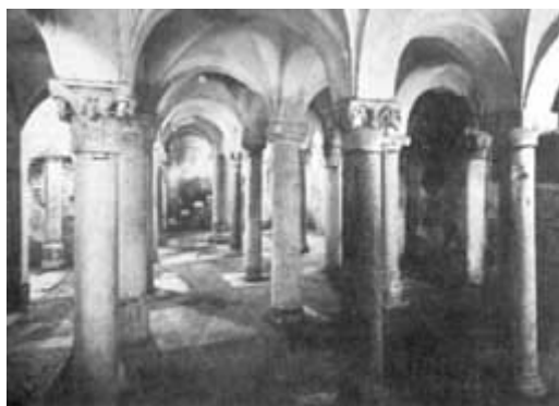
LA CRIPTA DI S. SALVATORE, AMPLIATA NEL SEC. XII

Legato al monastero era lo xenodochio o ospizio di S. Giulia, fondato, secondo qualcuno da Gisla nell'877 e dotato di 27 letti per i poveri e i pellegrini. Dipendeva dalla badessa ed era collocato lungo l'attuale via Piamarta, ad occidente del monastero.