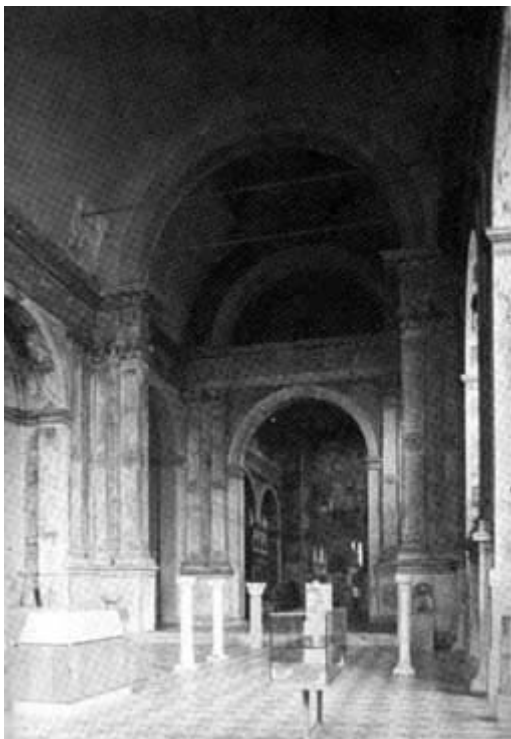
INTERNO DELLA CHIESA DI S. GIULIA A BRESCIA