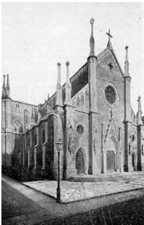
FACCIATA DELLA CHIESA PARROCCHIALE DI S. GIULIA