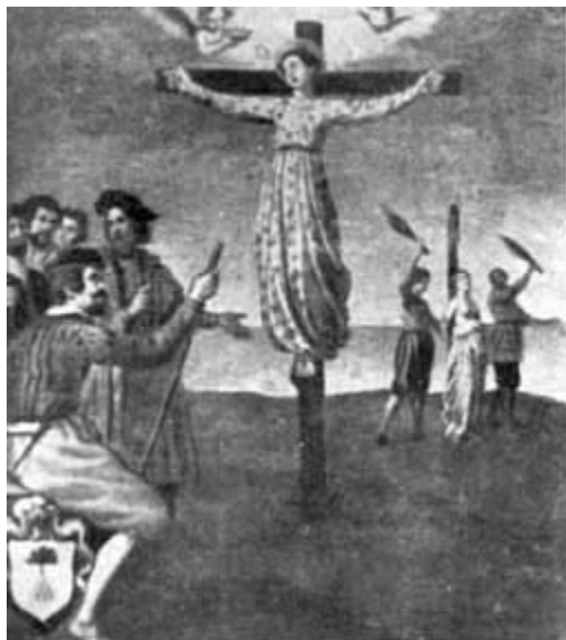
FUSTIGAZIONE E CROCISSIONE DELLA SANTA (Quadro di G. B. Marcati - sec. XVI)

Fattala slegare, tentò con nuove minacce e promesse di farla abiurare dalla fede cristiana, ma si trovò di fronte ad una